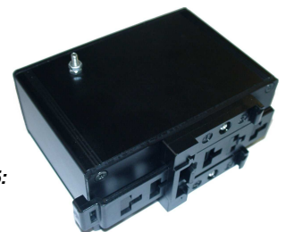
Montage auf Tragschiene TS35: