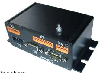
Montage mit Befestigungslaschen: